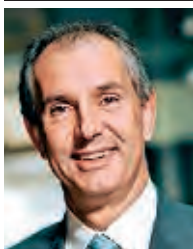
avocat à la Cour